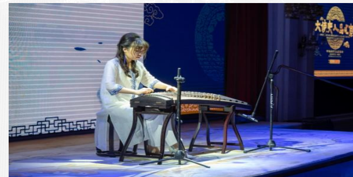
古筝演奏《春江花月夜》