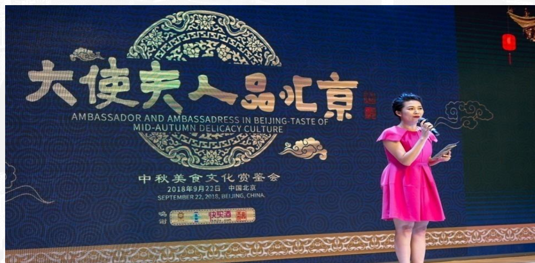
“金话筒奖”获得者、著名央广主持人、《大使夫人品北京》活动发起人 杜月媚 主持